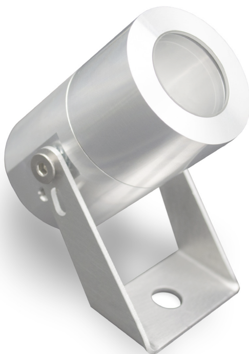
PETIT PROJECTEUR SMALL PROJECTOR