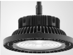
Montage sur mât Pole mount