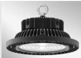
Montage par chaîne Chain mount