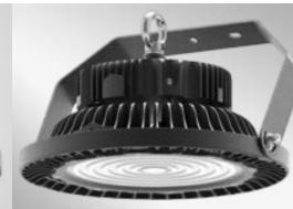
Montage sur étrier Surface mount