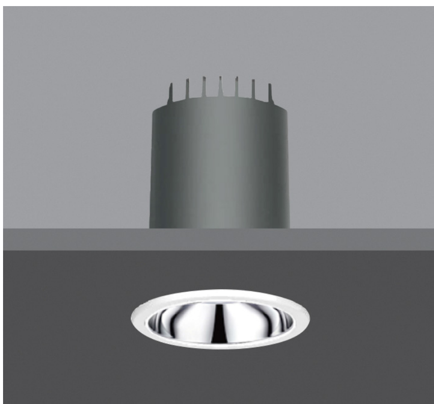
DOWNLIGHT ENCASTRÉ RECESSED DOWNLIGHT

SOLUTIONS D'INTÉRIEUR | ENCASTRÉS ORIENTABLES INSIDE SOLUTIONS | RECESSED ADJUSTABLE