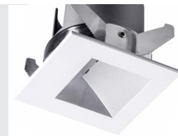
Couvercle magnétique rond ou carré (90x90mm) Round or square magnetic front cover (90x90mm)