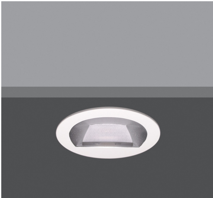
DOWNLIGHT ENCASTRÉ RECESSED DOWNLIGHT